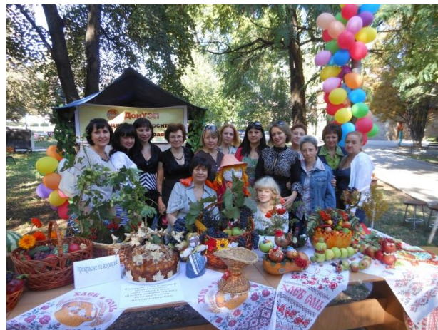
«Дари осені – 2015»