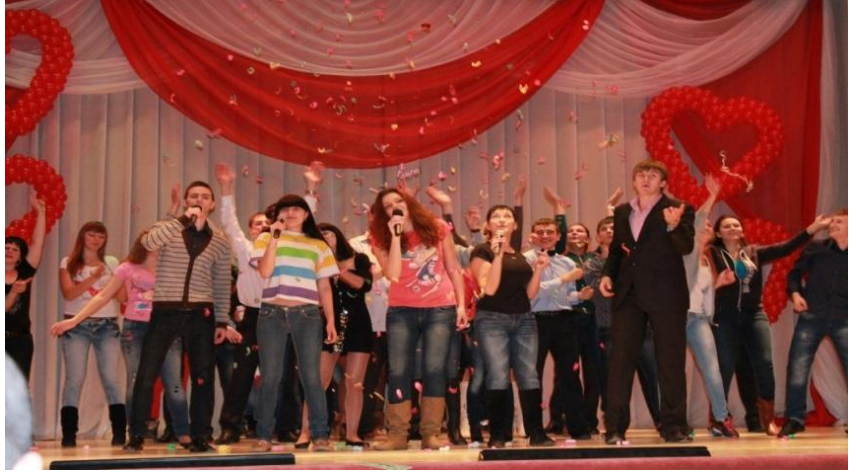
Дебют первокурсника: конкурс для настоящих студентов

В июле 2014 г. Финансово-правовой колледж ДонУЭП успешно завершил процедуру плановой аккредитации и получил от Министерства образования и науки Украины право выдавать государственные дипломы. Обучение студентов в Колледже осуществляют преподаватели высшей квалификации – доценты кафедр Университета и ведущие учителя гимназии «Сузір'я» ДонУЭП.