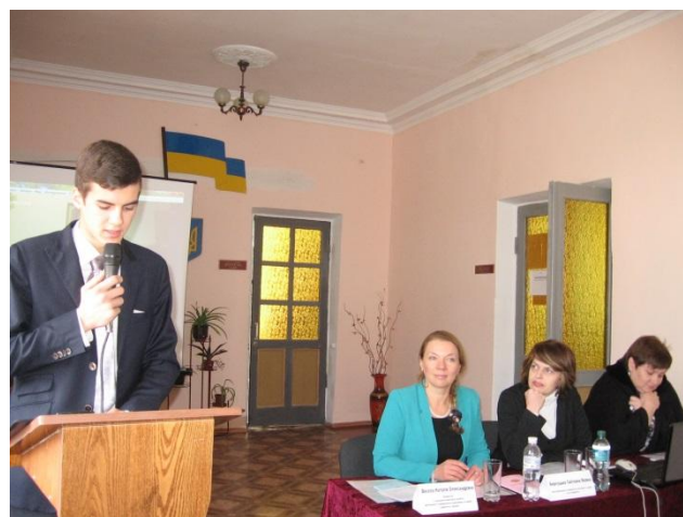
II Міжнародна студентська науково-практична конференція «Студенти та молодь – науці III тисячоліття»